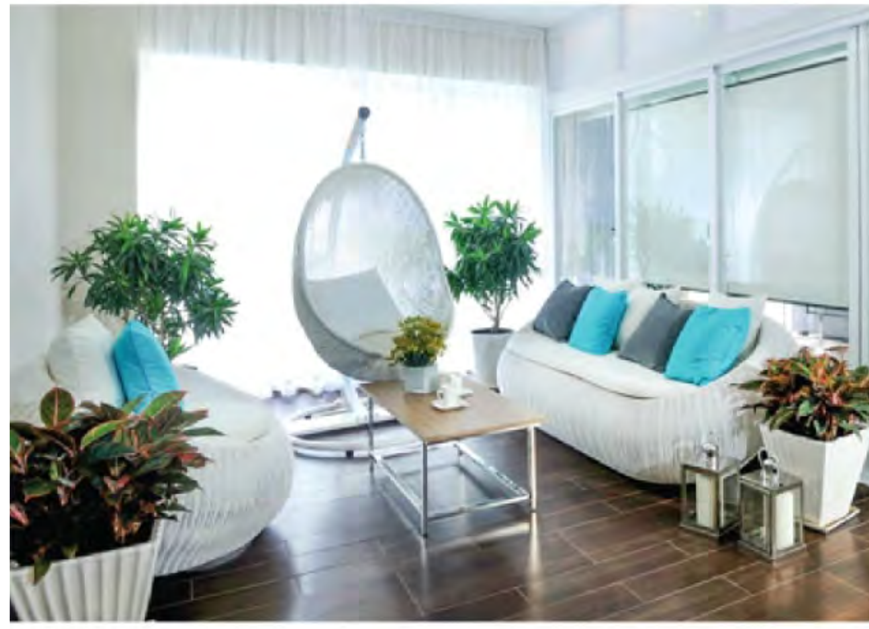
• Khoảng đệm trước hiên bước vào nhà của căn hộ mẫu kiểu B-134m 2