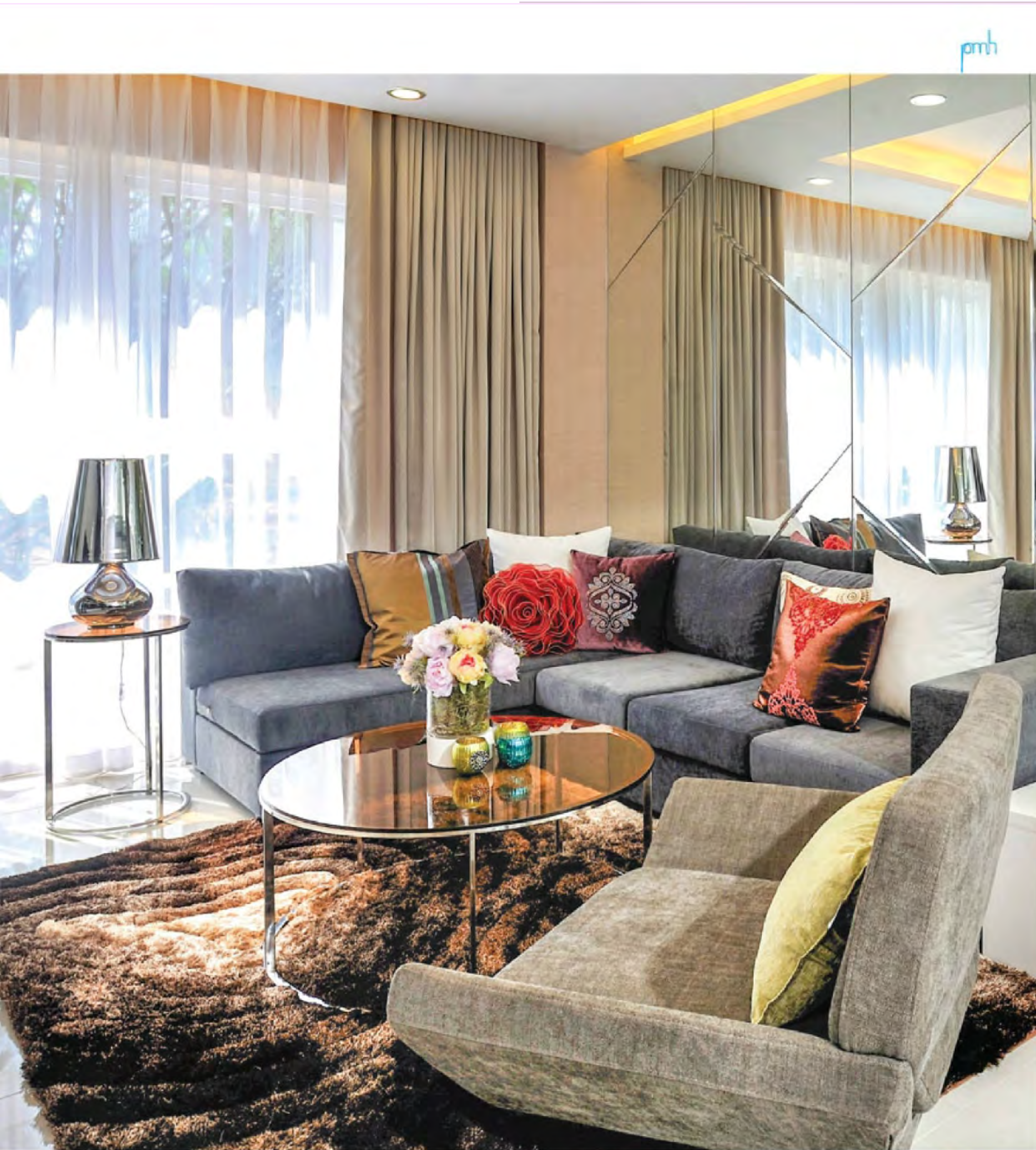
• Không gian phòng khách hiện ngắp ánh sáng tự nhiên của căn hộ kiểu B-134m 2