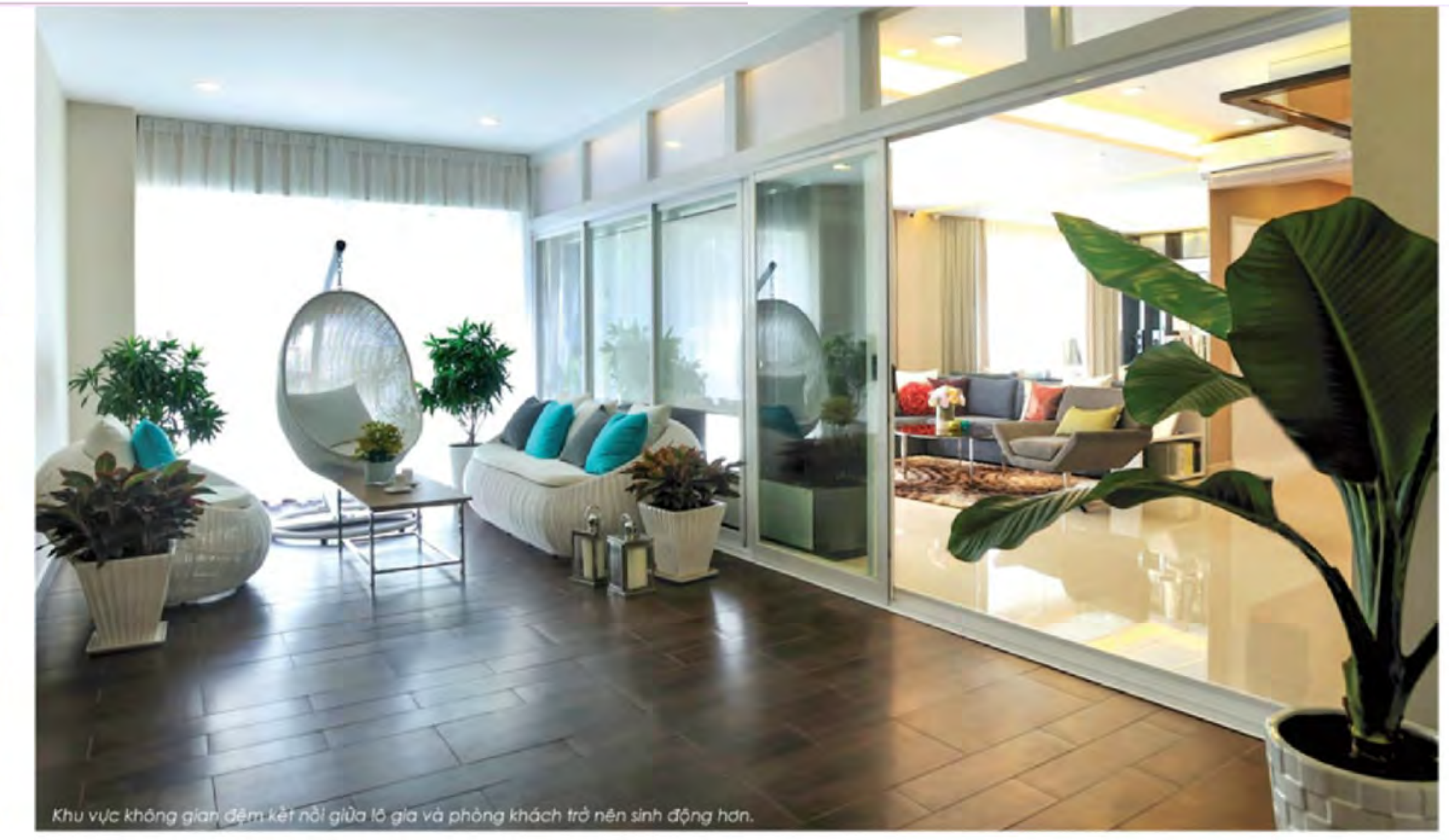
Khu vực không gian đệm kết nối giữa hiên và phòng khách trở nên sinh động hơn.

Nhà mẫu kiểu B được thiết kế có ba phòng ngủ. Khoảng không gian (lò ga) rộng phía trước được thiết kế làm lối dẫn vào nhà với bộ bàn ghế giả mây đơn giản tạo nên vẻ hiện đại, thông thoáng cho ngôi nhà ngay từ những bước chân đầu tiên. Phòng khách và phòng ăn, phòng bếp thông với nhau, nhưng qua chất liệu kính được dùng trang trí tường, không gian trở nên sang trọng, rộng rãi và thoải mái hơn. Các gam màu chủ đạo của nhà mẫu Happy Valley kiểu B này là những mảng màu mạnh, ấn tượng, trẻ trung ■