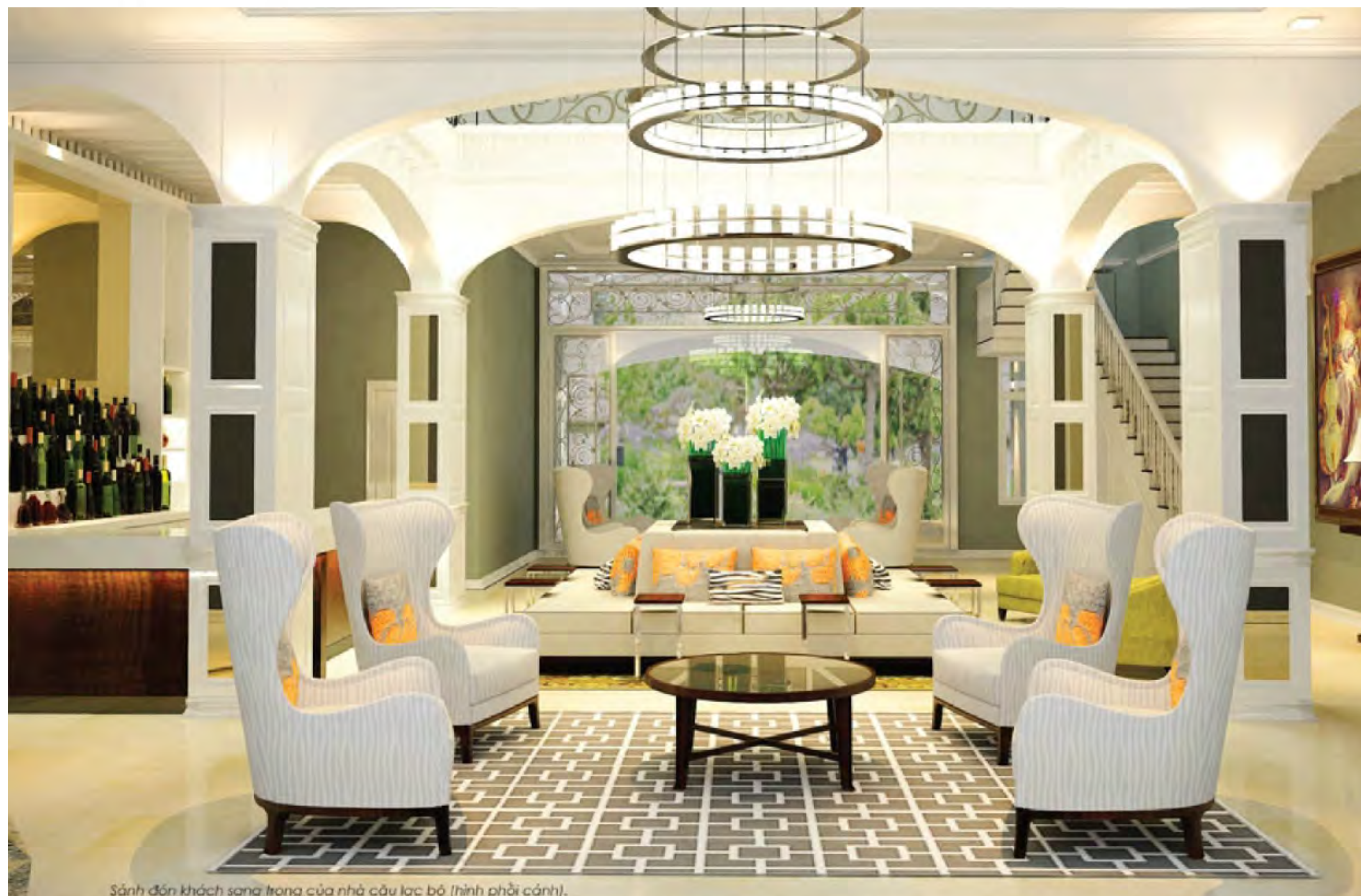
Sảnh đón khách sang trọng của nhà cầu bộ (tính phủ cảnh).