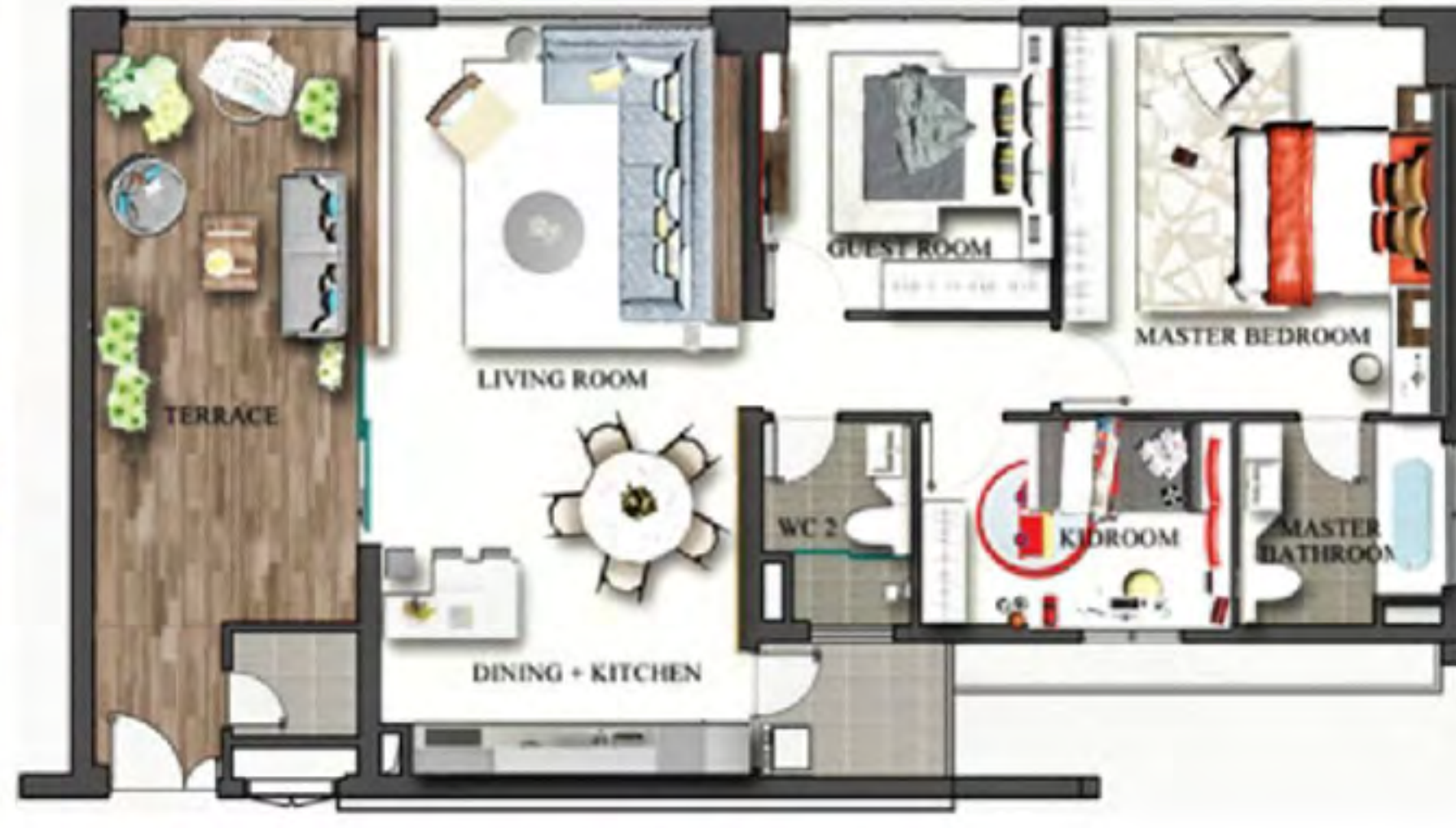
Một bảng bố trí nội thất tham khảo nhà mẫu kiểu B 134 m 2

Nhà mẫu kiểu C cũng phong cách nội thất hiện đại, đơn giản, nhà mẫu kiểu C có sự biến hóa linh hoạt bởi những đường nét gấp khúc trang trí trên tường hay kiểu dáng nội thất số pha, bàn ăn... Các phòng chức năng như phòng khách, phòng ăn, bếp, hai phòng ngủ lớn, một phòng cho bé được thiết kế khéo léo và thông thoáng ■