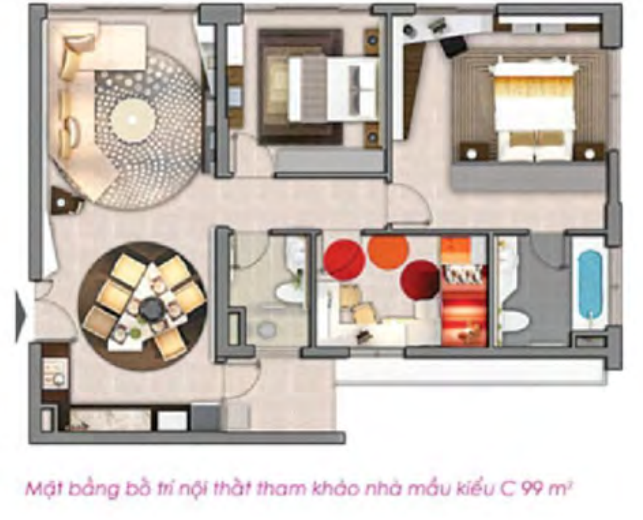
Một bảng bố trí nội thất tham khảo nhà mẫu kiểu C 99 m 2